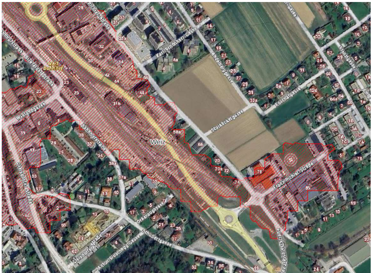
Abbildung 3: Beispielhafte Darstellung eines Bereichs einer möglichen Transformationsfläche in Weiz (Markus Karner, RaumRegionMensch, 2026)

Die systematische Zusammenstellung grün-blauer Anpassungsmaßnahmen im Projekt ermöglicht deren vergleichende Bewertung und transparente Zuordnung zu spezifischen räumlichen Situationen (van de Ven et al. 2016). Sie basiert auf wissenschaftlicher Evidenz und planerischer Erfahrung und berücksichtigt zentrale Kriterien wie Wirksamkeit, Kosten, Umsetzbarkeit, Zielkonflikte sowie Pflege- und Nutzungsperspektiven als Grundlage für die Priorisierung von Anpassungsoptionen im Siedlungsraum.