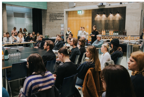
Abb. 2: Interdisziplinäres Diskussionsformat der Symposiumsreihe „Tischgespräch“ an der TU Graz am 31.03.2025