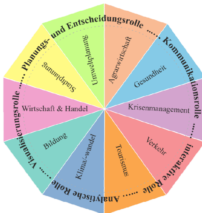
Abbildung 1: Die multifunktionale Rolle von GIS in verschiedenen Anwendungsbereichen (Eigene Darstellung)

Die folgende Grafik verdeutlicht die verschiedenen Anwendungsbereiche von GIS sowie die spezifischen Rollen, die diese Systeme in unterschiedlichen Kontexten einnehmen. Sie zeigt, dass GIS nicht nur als technisches Werkzeug, sondern auch als integraler Bestandteil von Entscheidungsprozessen, Planung und Kommunikation fungiert.