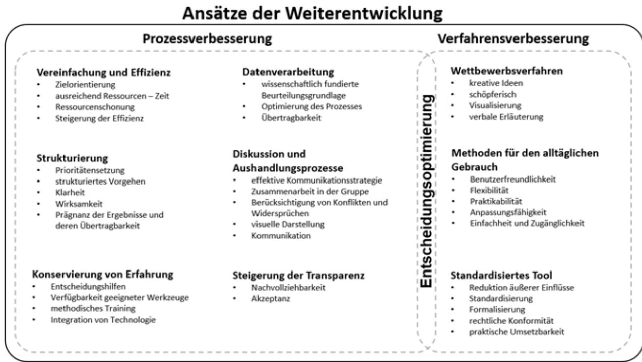
Abb. 3: Digitale Konzeptionalisierung der Ansätze der Weiterentwicklung (eigene Abbildung)