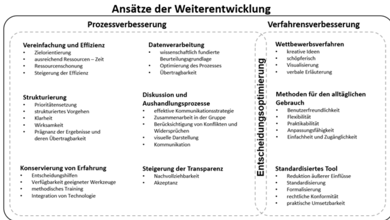
Abb. 2: Ansätze der Weiterentwicklung (verändert nach Müller 2025)

Die Übertragung von der empirischen Analyse zur Weiterentwicklung des Planungsprozesses mit dem Element der Entscheidungsoptimierung erfolgt dabei in zwei Schritten der Prozessverbesserung mit sechs Ansätzen und der Verfahrensverbesserung mit drei Ansätzen (vgl. Abb.2). Die Unterscheidung ist erforderlich, da empirische Analysen sowohl Probleme der Ablaufstruktur (Prozess) als auch der Entscheidungsmethodik (Verfahren) sichtbar machen. Alle Ansätze der Weiterentwicklung resultieren dabei ebenso aus den empirischen Erhebungen. Diese unterschiedlichen Ansätze erfordern differenzierte Formen der Ausgestaltung der Weiterentwicklung: