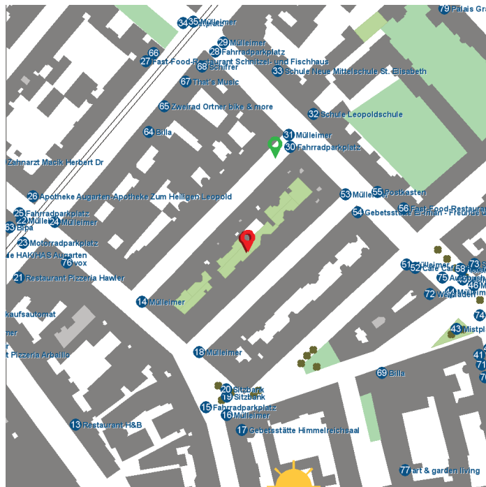
Abb. 2: Schnittstelle für Pflegepersonal und Angehörige mit Anzeige von Orientierungspunkten (Landmarks, Points of Interest).

Das Aktivieren des Notfallknopfes würde dazu führen, dass die betroffene Person angerufen wird; die Anruferin bzw. der Anrufer würde mit Hilfe des durch die verfügbare Information angereicherten Scripts ein Gespräch mit der betroffenen Person führen, das idealerweise eine konstruktive Auflösung der Desorientierungssituation induziert. Sollte eine positive Auflösung nicht möglich sein, so wären passende Eskalationsschritte vorzusehen, beispielsweise die Benachrichtigung einer Pflegeperson, der Behörden etc.