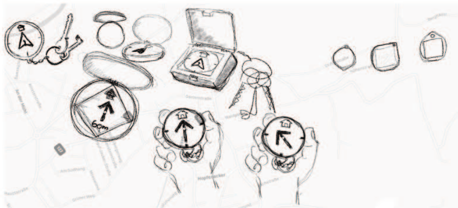
Abb. 4: Skizze der Handhabung und Funktion des Kompasses.

Der Kompass ist ein kleines Device, das beispielsweise am Schlüsselbund montiert oder als Armbanduhr verwendet werden kann und immer Richtung nach Hause deutet. Hierbei wird allerdings nicht einfach die richtige Himmelsrichtung angezeigt, sondern der Weg, der zu gehen ist, basierend auf einer zugrundeliegenden Landkarte oder einem Stadtplan.